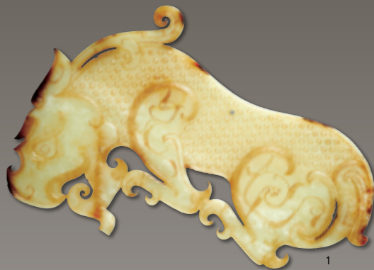
1. Plaque en forme de tigre, jade, Chine, fin de la dynastie Zhou ou début de la dynastie Han.