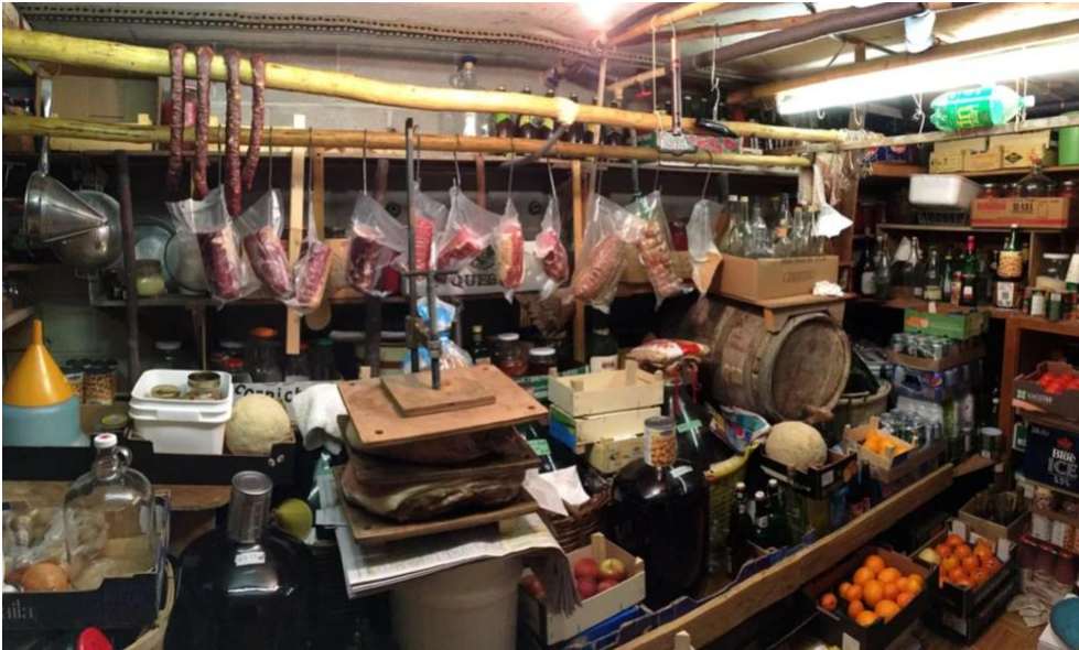
Exemple d'une cantina