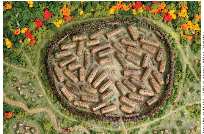
Maquette de Michel Cadieux